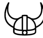
Grands jeux et rando